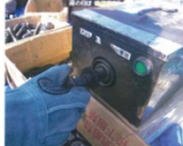
【ネット外し専用機械利用】